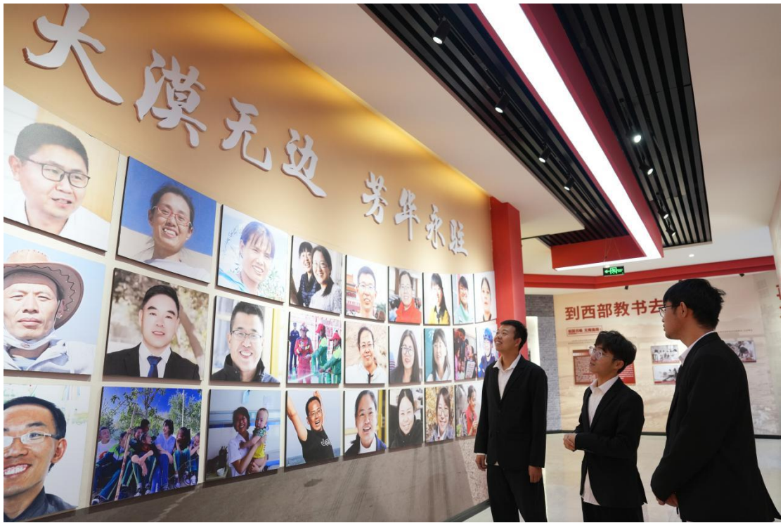
在且末县第一中学，河北援疆教师参观保定学院西部支教毕业生群体事迹展示馆。