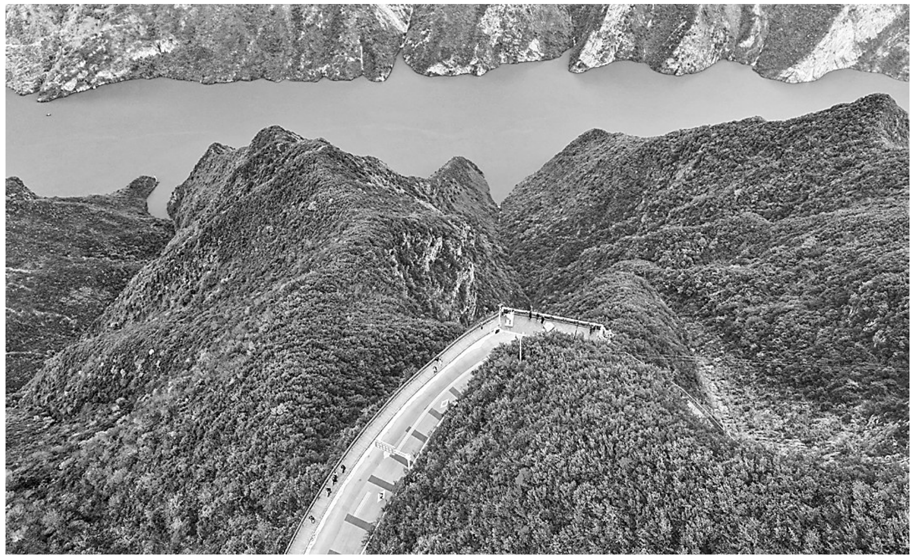
近日，游客在重庆巫山神女景区游览（无人机照片）。

夕阳西下时，我常常想起老宅的马棚，想起大红马温热的鼻息。原来有些告别早已写进岁月的年轮，而那些共同走过的时光，那些浸透汗水与温情的记忆，早已化作生命中最珍贵的财富，在心底生根发芽，长成一片永远葱郁的森林。